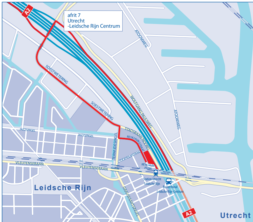
knooppunt Oudenrijn / 's-Hertogenbosch